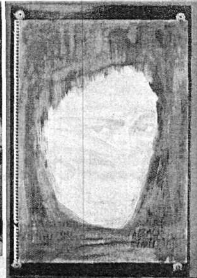
LUKISAN yang mengangkat motif kekejaman perang.

nya bermain dengan logik akal manusia," katanya, sambil menyatakan bahawa satu cakra padat interaktif multimedia yang dihasilkan oleh dua orang pelajar turut dilancarkan.