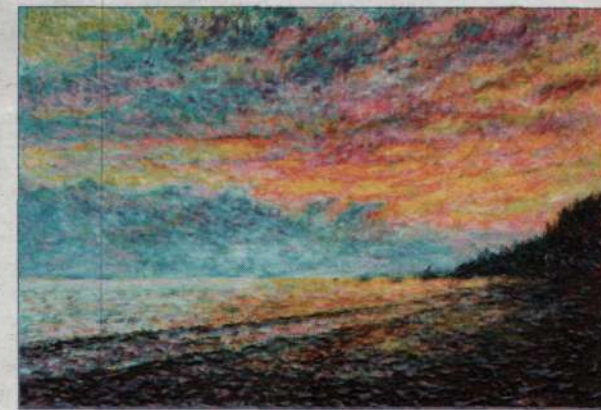
SUNRISE OVER MERSING

Setiap karyanya dijual pada harga antara RM1,500 hingga RM40,000.