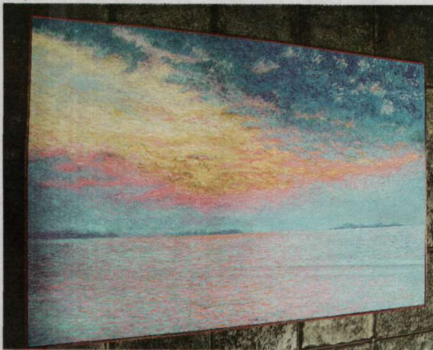
WAITING FOR SUNRISE OVER TELOK KALONG