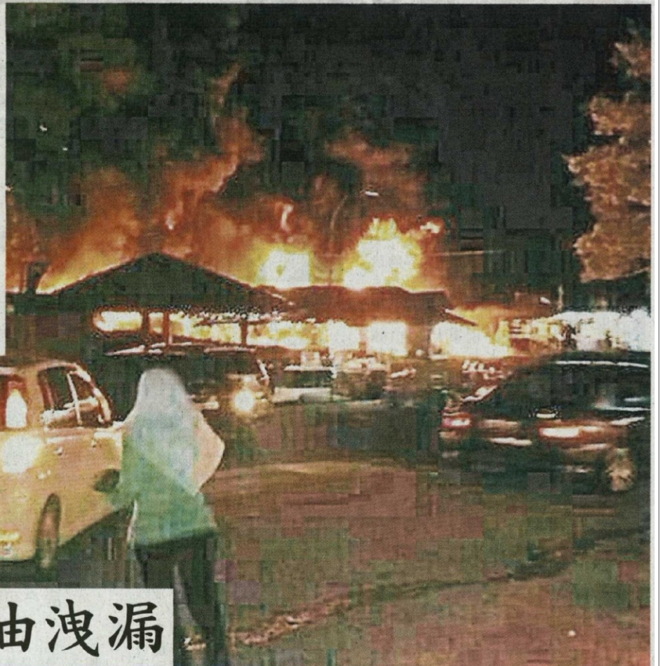
■不远处发生火灾，这名女车主赶紧乘车远离灾场。