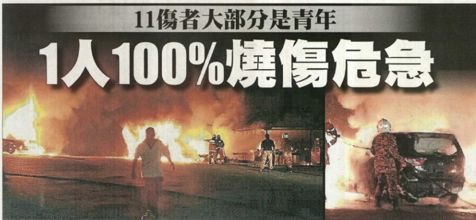
消防員趕抵現場，馬上展開滅火工作，阻止火勢蔓延。