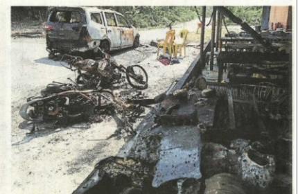
↑ 食燒中其前被燒毀一輛摩托車和3輛摩托車。 ↓ 被燒毀的食檔。

消防員一抵現場，馬上展開滅火工作，阻止火勢蔓延，但是失火的車輛還是燒得面目全非。