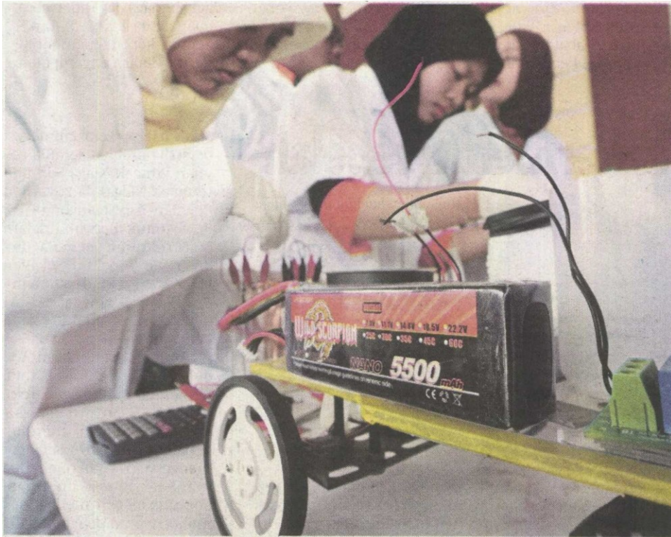
ANTARA gelagat peserta pada pertandingan Malaysia Chem-E-Car 2014 .