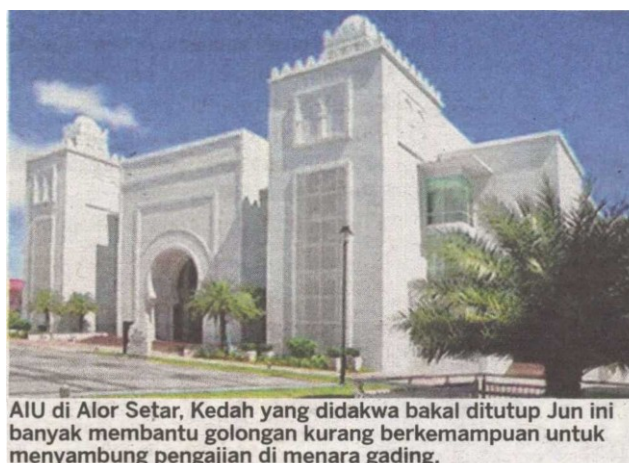
AIU di Alor Setar, Kedah yang didakwa bakal ditutup Jun ini banyak membantu golongan kurang berkemampuan untuk menyambung pengajian di menara gading.

pada Jun depan susulan masalah dalaman yang dihadapinya.