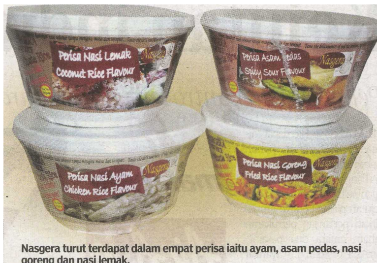
Nasgera turut terdapat dalam empat perisa iaitu ayam, asam pedas, nasi goreng dan nasi lemak.