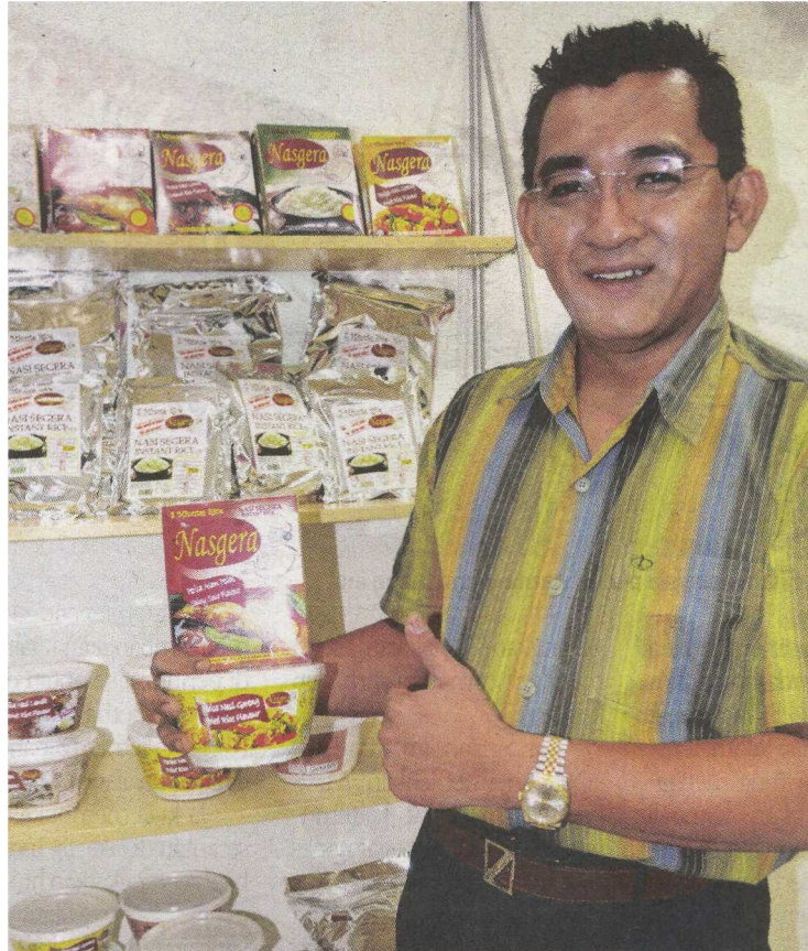
Khalid berharap Nasgera menjadi jenama yang dikenali dalam pasaran tempatan sebagai peneraju makanan ruji segera.